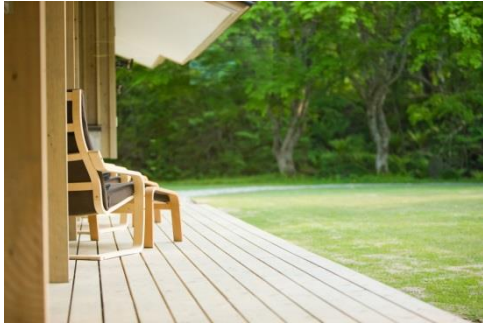
リラックスした時間を過ごすデッキ