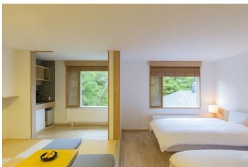
北欧スタイルの客室

ホテル内のラウンジ、レストラン、浴室、客室のどこからでも窓越しに目に入る風景は自然の中で暮らしているような印象を受けます。当日 3 時チェックインの翌日 12 時チェックアウトの多くの時間をホテルや周辺散策で過ごされるお客様が多いとのこと。