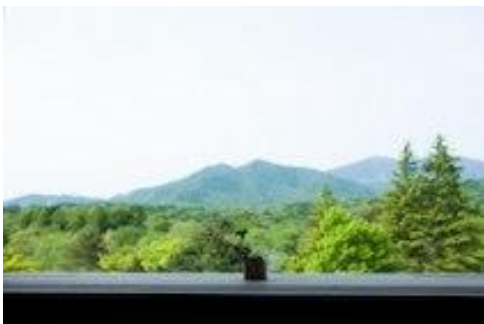
バルコニーからの吾妻連峰の眺望