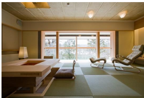
スイートルームタイプの客室