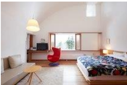
北欧デザインのチェアが人気の客室