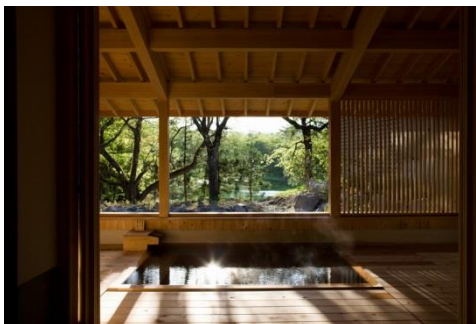
源泉掛け流しの温泉