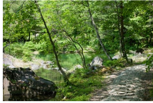
敷地内の湧き沼と自然の生態系