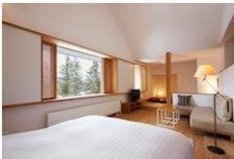
吾妻連峰が堪能できる和室付きの客室