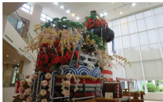
お祭り広場イメージ図

参加した地区住民の方々からは、施設整備に伴う観光バス・マイカー等の交通問題、埋蔵文化財保存と施設整備のあり方、総事業費と維持管理の関係、歴史展示と観光情報発信の区分、説明会の開催手法など多方面に渡る質疑が行われました。