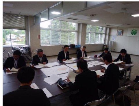
面図及び模型による説明

本計画は矢吹町が平成28年度に策定した基本構想を受け、当組合が平成29年度に基本計画から受託している施設設計で、引き続きプロポーザル設計競技で選定された鈴木伸幸建築事務所&エスデー設計研究所が担当しています。