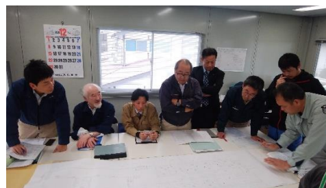
施工図による機器取付確認