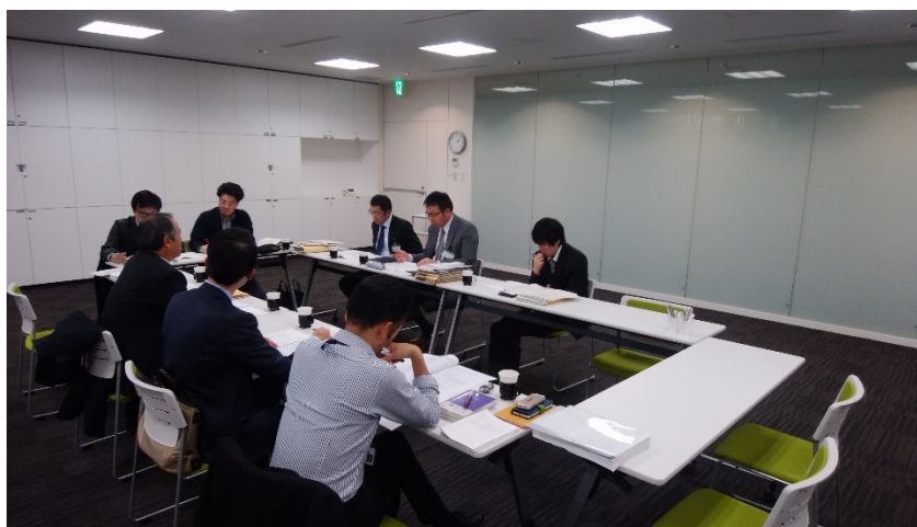
事務局打合せ風景

前回までの審議会からの意見・要望や事務局側からの提示データ等を基に担当事務所が作成した素案は、第一章：現状分析（データ等）、第二章：基本理念・方針（病院機能）、第三章：部門別計画（外来等15部門）、第四章：施設整備計画（規模、配置、機器等）、第五章：事業計画（整備手法、事業費等）、参考資料等から成り、各章ごとに数値や文言の加除修正及び基本的な考え方について意見交換することで相互理解を深めた。