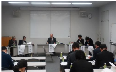
事例：二本松城文化観光施設新築基本設計／伊達市こどもの物語ミュージアム新築基本・実施設計