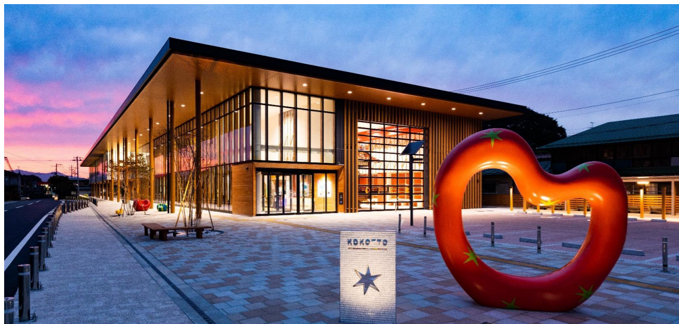
■矢吹町複合施設：KOKOTTO：ココット