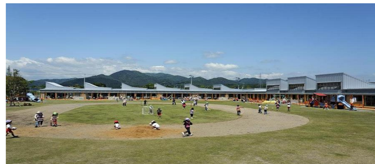
■檜葉町 幼保一元化施設あおぞらこども園(第28回福島県建築文化賞受賞作品)