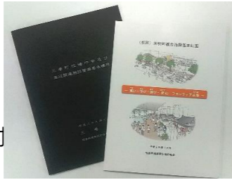
事例：三春町役場庁舎及び周辺関連施設整備基本構想／矢吹町複合施設基本計画