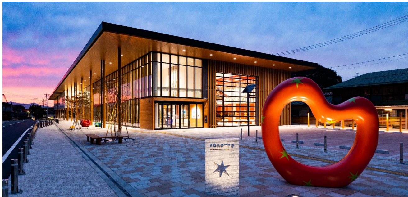
■矢吹町複合施設：KOKOTTO：ココット