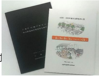
事例：三春町役場庁舎及び周辺関連施設整備基本構想／矢吹町複合施設基本計画