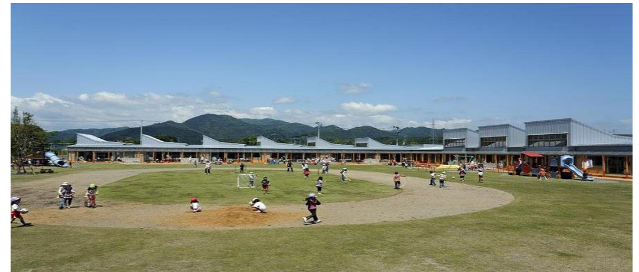
■檜葉町 幼保一元化施設あおぞらこども園(第28回福島県建築文化賞受賞作品)