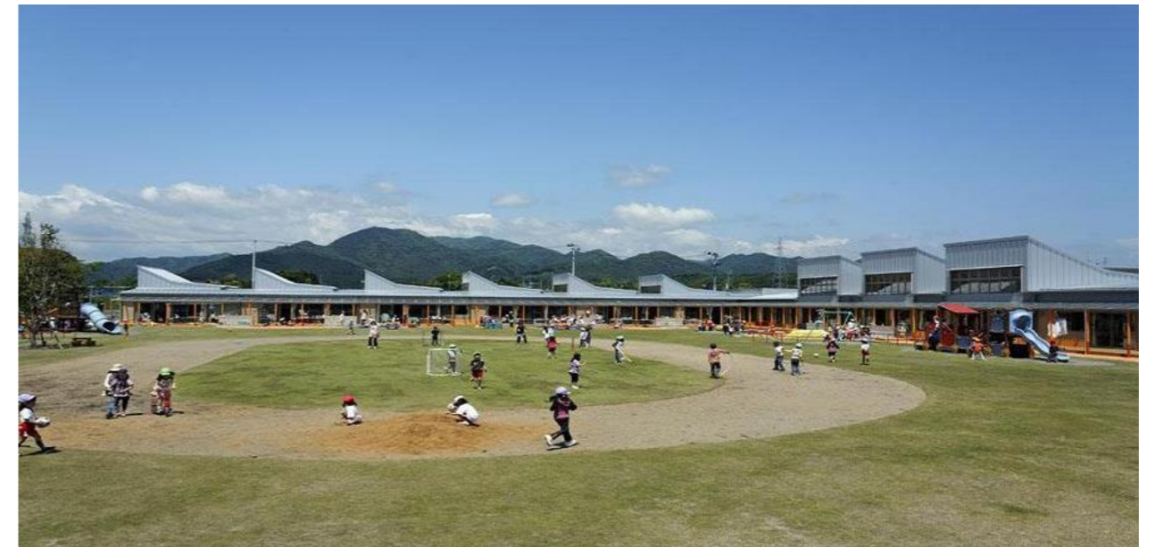
■檜葉町 幼保一元化施設あおぞらこども園(第28回福島県建築文化賞 正賞)