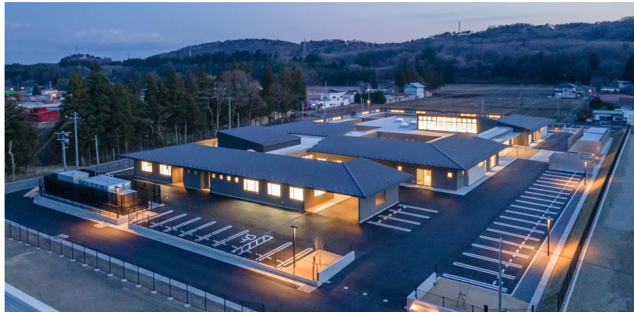
■福島県浪江ひまわり荘(令和5年度 第39回福島県建築文化賞 復興賞)