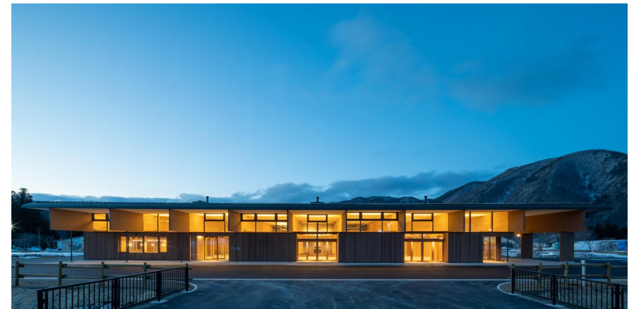
■みなみあいづ森と木の情報・活動ステーション：きとね(令和5年度 第39回福島県建築文化賞 正賞)